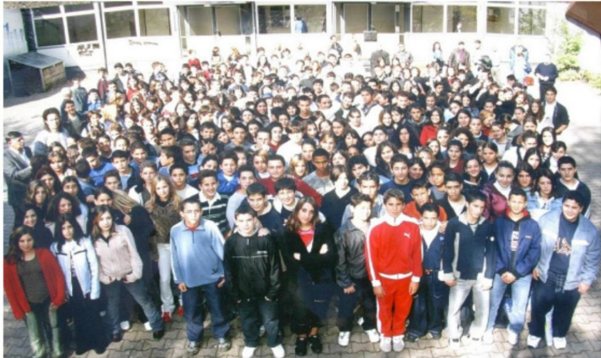
Μαθητές και καθηγητές του Γυμνασίου Νυρεμβέργης (2003)

Το 2002-2003 στα γερμανικά σχολεία εισάγεται το Mittlerer Schulabschluss M-Zug και οι πρώτοι μαθητές των ελληνικών σχολείων που δίνουν εξετάσεις σε αυτό είναι το 2009-2010.