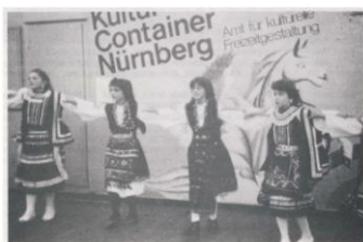
Schülerinnen und Schüler unserer Schule werden für Griechenland: Griechische Folklore auf dem Nürnberger Altstadt-Fest

Μέσα στα χρόνια τα σχολεία ανέπτυξαν σημαντικό πολιτιστικό έργο για το μαθητικό τους πληθυσμό και την ελληνική κοινότητα της Νυρεμβέργης.