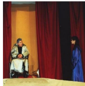
2000/2001 Αντιγόνη (Antigone des Sophokles)